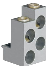
0 262 70