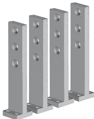
0 263 83