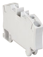
0 372 63