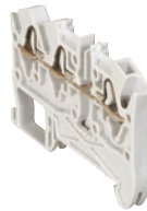
0 372 40