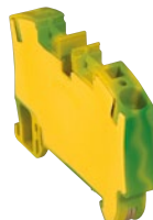
0 372 72