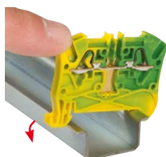
0 372 70 Автоматическая фиксация на рейку 4