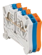
0 372 60 + 0 372 00 + 0 372 20