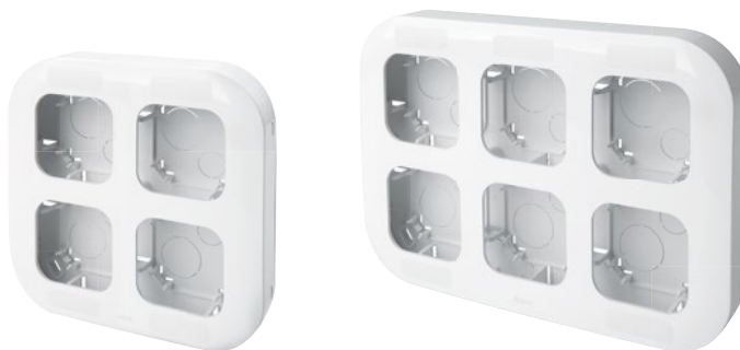
7 822 94