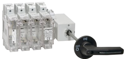
6 051 10+6 051 23