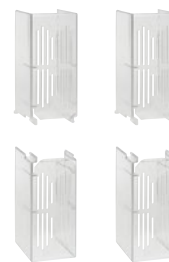
6 051 33

Технические характеристики и размеры стр. 117-119