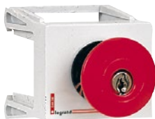
0 044 06 Пример установки: выключатели, индикаторы