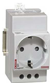
0 042 85