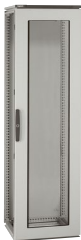
0 473 62