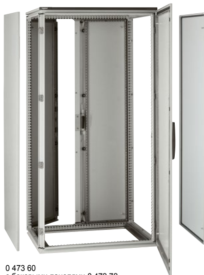
0 473 60 с боковыми панелями 0 472 72