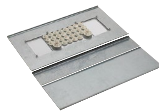
0 481 74+0 481 79