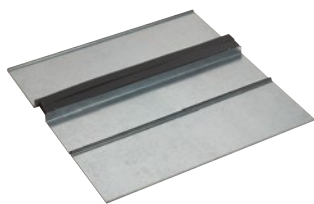
0 481 64+0 481 78