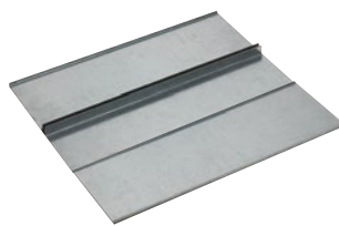
0 481 82+0 481 78