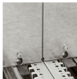
Пример монтажа 2 монтажных плат с расширенной базой в сборных шкафах (промежуточная плата не требуется)