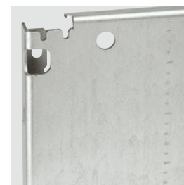
Разметка, наносимая на перфорированные и цельные монтажные платы

Технические характеристики стр. 254 Крепеж стр. 251 и 280