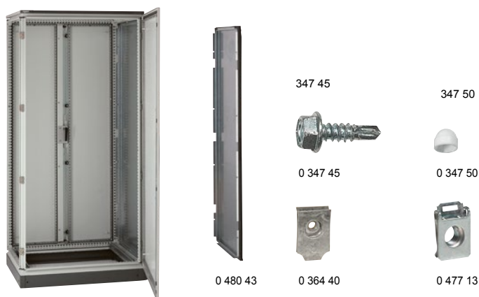
Пример шкафа с разделительной перегородкой Кат. № 0 480 43