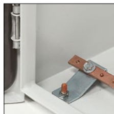
0 367 36 + 0 373 89 (стр. 345)