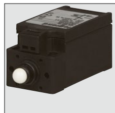
0 363 13