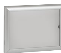
0 475 45