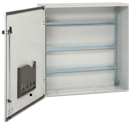
Металлические шкафы Atlantic