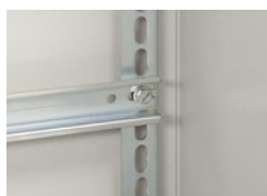
0 367 84 с клипса-гайками 0 364 42 + винты 0 367 75