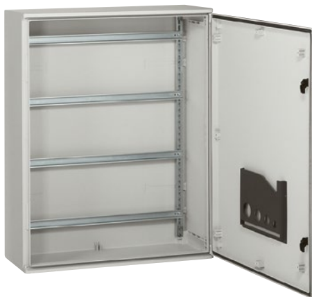
Полиэстеровые шкафы Marina