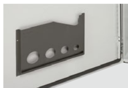
0 365 80