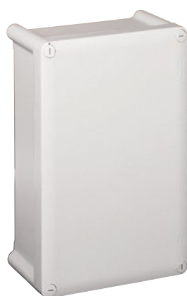
0 359 70