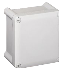
0 350 13