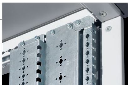
0 211 37

Состав комплекта (вариант): - верхняя панель и основание шкафа Кат. № 0 211 35 - опорные стойки Кат. № 0 211 36 - монтажные стойки Кат. № 0 211 37 - задняя панель Кат. № 0 211 41 - рама для крепления лицевых панелей Кат. № 0 208 55 - рым-болты Кат. № 0 205 82