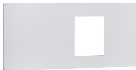
0 211 39