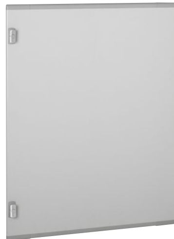
0 212 76