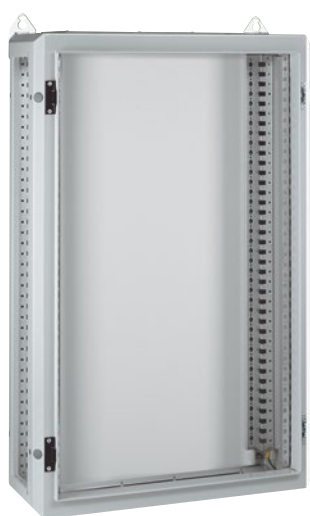
0 204 51