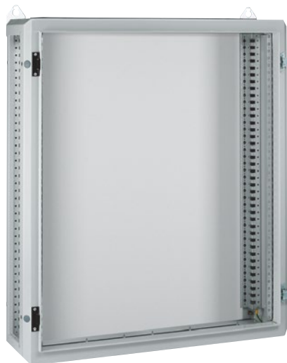
0 204 56