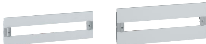
0 203 00