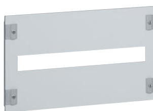
0 203 10