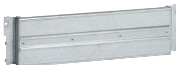
0 202 11

оборудование для монтажа DPX 3 160, DPX 3 250 и DPX-IS 250 на монтажную плату