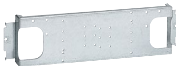
0 202 13