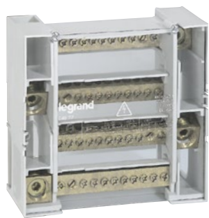
0 048 77