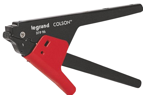
0 319 96