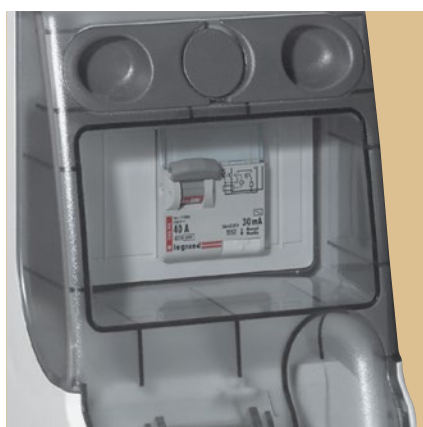
■ Прозрачная крышка для отсека с аппаратами защиты