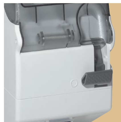
■ Выключатель с двойной блокировкой позволяет подать напряжение, только если вилка вставлена в розетку (1 блокировка). Вилка не извлекается из розетки без отключения напряжения (2 блокировка).