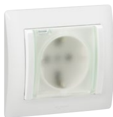
7 759 24 White