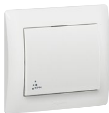
7 758 52 White